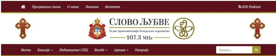
Слика 3: Заглавље насловне стране веб странице радија „Словољубве“ (Преузето 20.8.2022. са http://www.slovoljubve.com/ )

Електронски медиј са дугом традицијом је радио, који се може слушати путем ФМ фреквенције, али и путем Интернета. Посматрајући и истражујући постојање радио станица, специјализованих за вјерски садржај, може се закључити да у Србији постоји највише православних, вјерских радио станица, које својим постојањем и тематиком мисионаре и долазе до вјерујућег народа. Најслушаније радио станице су: „Слово љубве“ (Архиепископија београдско – карловачка), „Милешева“ (Епархија милешевска), „Беседа“ (Епархија бачка), „Златоусти“ (Епархија шумадијска), „Искон“ (Епархија врањска), „Глас“ (Епархија нишка), „Словословље“ (Црквена општина суботичка), „Искон“ (Епархија ваљевска), „Српски Сион“ (Епархија сремска).