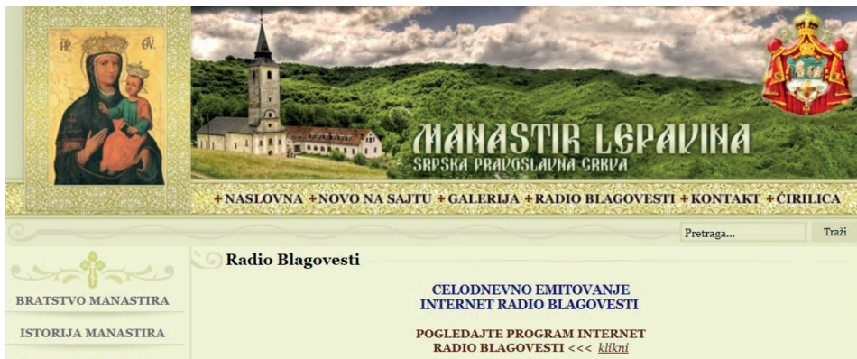
Слика 5: Заглавје насловне стране веб странице манастира Лепавина (Преузето 20.8.2022. са http://www.manastir-lepavina.org/stranica.php?id=18 )

Позиционирање се заснива на избору онога по чему желимо да будемо препознати. Позиционирање као стратегија отвара додатне могућности за нове варијанте, а тиме и за разноврсност. Позиционирање подразумјева избор одређених значења и њихово истицање. (Котлер Ф., Триас Де Бес Ф., 2005:41)