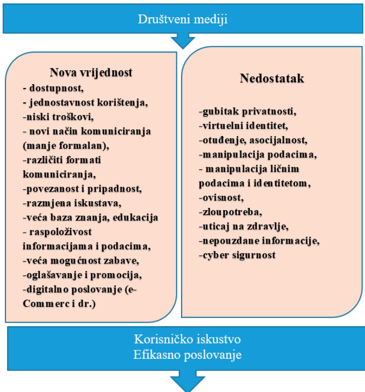
Slika 1. Prednosti i nedostaci društvenih medija